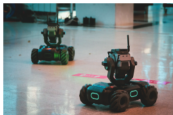
IT-ярмарка «COOKIE FEST» - стр. 8