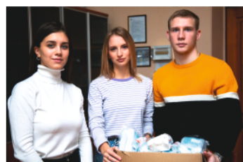
Штаб #МыВместе - стр. 14