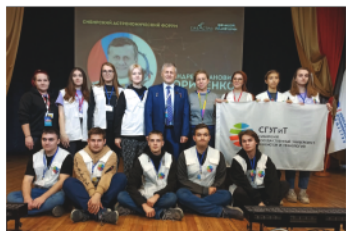
Форум «СибАстро» - стр. 3