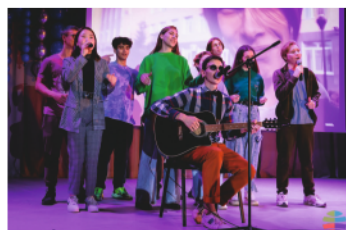
Дебют первокурсника - стр. 10