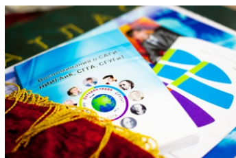
Центр истории и культуры СГУГИТ - стр. 9