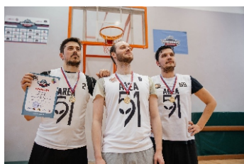
Отборочный турнир чемпионата АССК - стр. 12