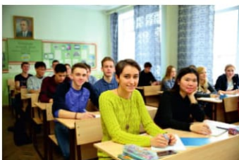
Так не бывает — стр. 10