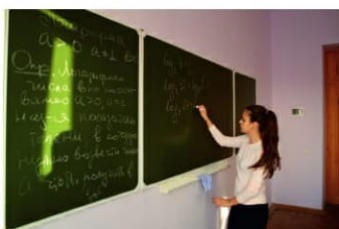
Будущее поколение — стр. 8