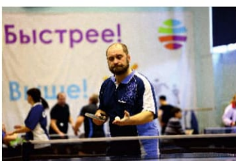
Бодрость и здоровье — стр. 13