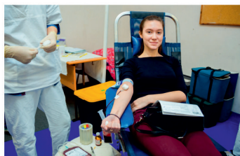
Донорно-акцепторная связь — стр. 11