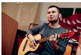
Все на борту! — стр. 10