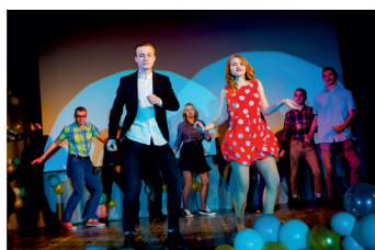
Впервые на сцене! — стр. 6