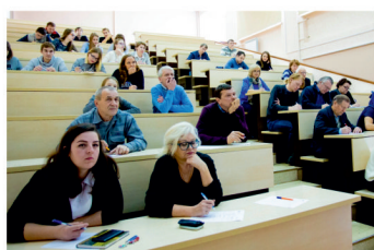
Широка страна моя родная — стр. 12